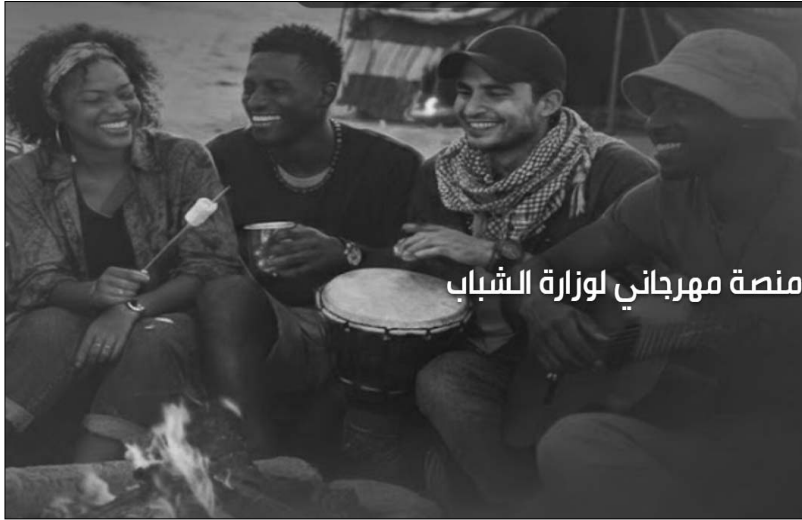
منصة مهرجاني لوزارة الشباب

Le ministère de la Jeunesse a annoncé, dans un communiqué, le lancement officiel de la plateforme "Mahrajani", dédiée aux inscriptions aux festivals nationaux de la jeunesse.