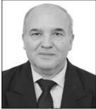
Par Abderrahmane MEBTOUL professeur des universités, expert international

La Première ministre italienne Giorgia Meloni, se rendra à Alger le 25 mars dans le cadre d'une visite officielle visant à renforcer la coopération stratégique entre l'Italie et l'Algérie, notamment dans le secteur de l'énergie. Selon Agenzia Nova, cette visite s'inscrit dans un contexte international marqué par des tensions géopolitiques et une pression croissante sur les marchés gaziers. plus de la fermeture du détroit d'Ormuz où transitent environ un quart des exportations mondiales d'hydrocarbures, la guerre Iran-USA via Israël a franchi une nouvelle étape dangereuse avec les attaques contre les sites énergétiques que ce soit en Arabie Saoudite, en Irak, au Qatar, au Koweït, à Oman, aux Emirats et réciproquement contre les installations en Iran où cet espace concentre plus de 40% des réserves mondiales, avec des incidences négatives sur la croissance de l'économie mondiale, une hausse de l'inflation.