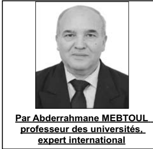
Par Abderrahmane MEBTOUL professeur des universités, expert international

Pour l'ensemble de l'Union européenne l'Algérie pour 2025 a représenté entre 21/22% de ses sources d'approvisionnement en gaz naturel représentant pour l'Algérie selon la banque d'Algérie environ 80% de ses exportations d'hydrocarbures. Aussi, les récentes visites 25/26 décembre 2026 de la première ministre italienne en Algérie et du ministre des Affaires étrangères espagnol s'inscrivent dans un contexte international marqué par des tensions géopolitiques et une pression croissante sur les marchés gaziers et pétroliers qui connaissent une très forte volatilité, fonction des tensions au Moyen Orient avec le risque d'une récession de l'économie mondiale couplée avec une forte inflation.