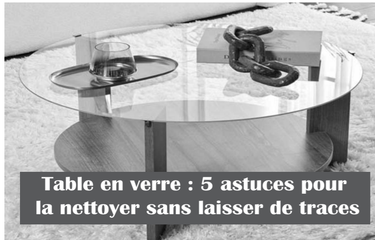
Table en verre : 5 astuces pour la nettoyer sans laisser de traces

Pour nettoyer une table en verre après chaque utilisation ou repas, on peut se contenter d'utiliser une éponge non abrasive ou un chiffon doux non pelucheux (type chiffon microfibre), tous deux préalablement humidifiés. Pour ce faire, imbibez-les avec de l'eau distillée. En effet, l'eau du robinet pouvant contenir du calcaire qui laisse des traces blanches sur le verre. Ensuite, il n'y a plus qu'à faire des mouvements circulaires pour retirer les saletés. Utiliser le papier journal comme pour les fenêtres. Le papier journal chiffonné et humidifié que vous utilisez déjà pour vos vitres et miroirs se révélera tout aussi efficace sur votre table vitrée. Il suffit de frotter doucement en décrivant de petits cercles pour obtenir une table propre et brillante sans effort. Sortez votre liquide vaisselle, tout simplement ! Si vous avez renversé du vin, du gras ou du café sur votre table à