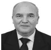
Par Dr Abderrahmane Mebtoul Professeur des universités, expert international.

Que ce soit du côté des USA ou de l'Iran, la guerre ne devrait pas durer les officiels annoncent que les négociations continuent au Pakistan, l'enjeu majeur des négociations outre le nucléaire dont les USA viennent de reconnaître un enrichissement à des fins pacifiques pour l'Iran, est le blocus du détroit d'Ormuz. Concernant le drame au Liban, ou des négociations préliminaires devraient avoir lieu à Washington selon le président les tensions au Moyen Orient ayant montré que les chiites représentent environ 27 % à 31 % de la population totale selon les estimations (dont CIA World Factbook et œuvre d'Orient) concentrés principalement au Liban-Sud, dans la Bekaa et dans la banlieue sud de Beyrouth ne sauraient dans leur immense majorité les assimiler à la branche armée du Hezbollah qui avec les Houthis au Yémen sont des branches armées des gardiens de la révolution et que sans l'accord de l'Iran, ces négociations ont peu de chances d'aboutir et que les tensions persistent en Mer rouge. Les américains étant autonome et exportateur en hydrocarbures, grâce au pétrole gaz de schiste, mais 80% des exportations iraniennes étant destinées à la Chine à des prix plafonnés) et bon nombre d'Asie étant pénalisés, les exportations iraniennes ne dépendent pas du détroit d'Ormuz mais de l'île de Kharg (ou Khârg) située dans le nord du golfe Persique, vitale