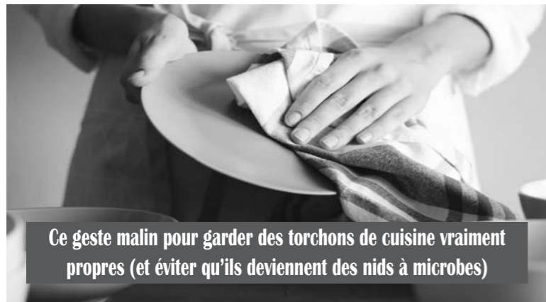
Ce geste malin pour garder des torchons de cuisine vraiment propres (et éviter qu'ils deviennent des nids à microbes)

À première vue, le torchon de cuisine est un objet anodin. Pourtant, c'est l'un des foyers de bactéries les plus importants au sein de la maison où l'humidité, la chaleur et les restes alimentaires favorisent leur multiplication. Contrairement aux éponges, souvent pointées du doigt, les torchons échappent à la vigilance, circulant sans relâche de la vaisselle humide à la table, d'une main à l'autre. Résultat : s'ils ne sont pas changés ou lavés fréquemment, ils deviennent rapidement un véritable terrain de jeu pour les microbes. Les textiles humides, surtout froissés sur le plan de travail ou suspendus dans une cuisine peu ventilée, permettent aux bactéries, levures et moisissures de se développer à grande vitesse. Un simple usage après avoir essuyé une volaille, un œuf cassé ou des légumes terreux et le torchon peut, sans qu'on s'en rende compte, contaminer les mains, les ustensiles ou les aliments à son tour. Entre routine et rythme effréné, il n'est pas rare de voir un même torchon servir plusieurs jours, voire toute une semaine. Le lavage des torchons reste une tâche invisible, reléguée au second plan derrière des missions jugées plus urgentes